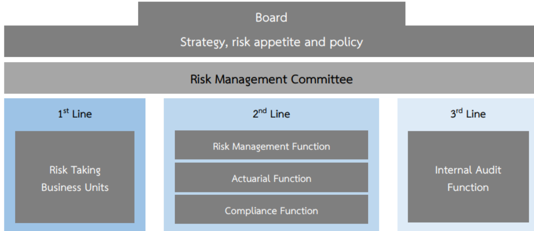
แผนภาพที่ 1: แสดง 3 line of defense

กระบวนการบริหารความเสี่ยง ภายใต้กรอบการบริหารความเสี่ยง เป็นไปตามแนวทาง 3 line of defense โดยได้แบ่งหน้าที่ความรับผิดชอบในการบริหารความเสี่ยงเป็น 3 ส่วน ดังนี้